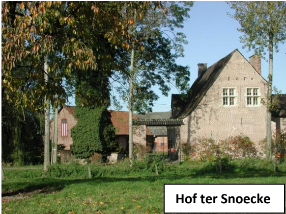
Hof ter Snoecke

De 15, 20, 24 en 29 km vertrekken via de Haasdonkse bossen, veldwegen en het Fort van Haasdonk , (dit fort is nu een beschermd natuurgebied en verblijf en broedplaats voor vele vleermuizen), richting rustpost in Haasdonk. Hier hebben we een rustpost in het voormalige Gemeentehuis dat aan de dorpsplein staat te pronken. Vanuit deze rustpost keert de 15 km terug naar het einde. De