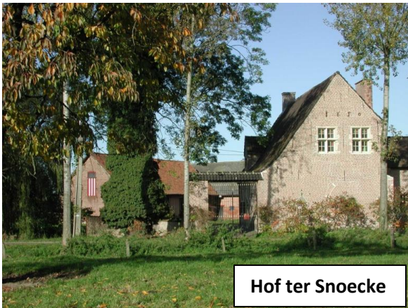
Hof ter Snoecke

De 15, 20, 24 en 29 km vertrekken via de Haasdonkse bossen, veldwegen en het Fort van Haasdonk , (dit fort is nu een beschermd natuurgebied en verblijf en broedplaats voor vele vleermuizen), richting rustpost in Haasdonk. Hier hebben we een rustpost in het voormalige Gemeentehuis dat aan de dorpsplein staat te pronken. Vanuit deze rustpost keert de 15 km terug naar het einde. De