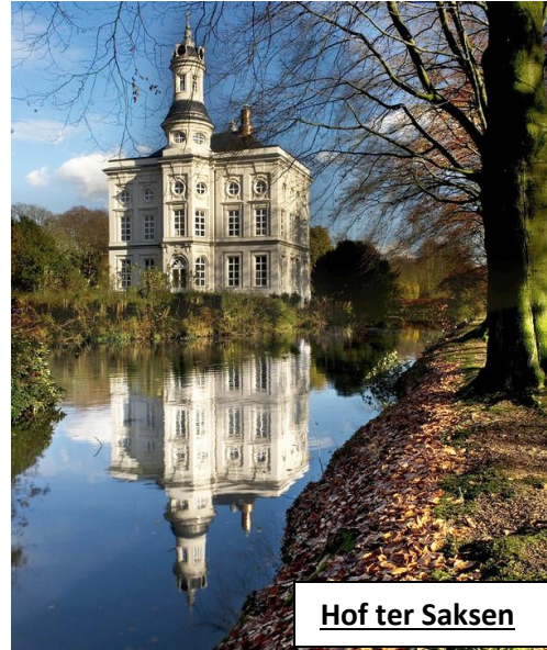
Hof ter Saksen

Voor de 4 km (uiterst geschikt voor de rolstoelen) hebben we een rustige landelijke wandeling over rustige baantjes en goed verharde wegen richting Nieuwkerken. De 6 km is ook geschikt voor rolstoelen maar wel voor kinderwagens daar zij (achter het recreatiepark de Ster) door een mooi stuk van de Haasdonkse bossen gaan. De moeilijkste stukken worden omzeilt door kleine omwegjes, maar ook in de bossen. De 11 km is een combinatie van de 4 en de 6 km en heeft een rustpost in de vertrekzaal.